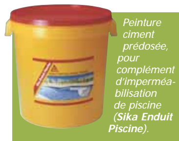
Peinture ciment prédosée, pour complément d'imperméabilisation de piscine (Sika Enduit Piscine).

autant de données auxquelles veillent les professionnels de ce type de produit où certains paramètres restent à l'appréciation de chacun, selon la formule d'enduit appliquée.