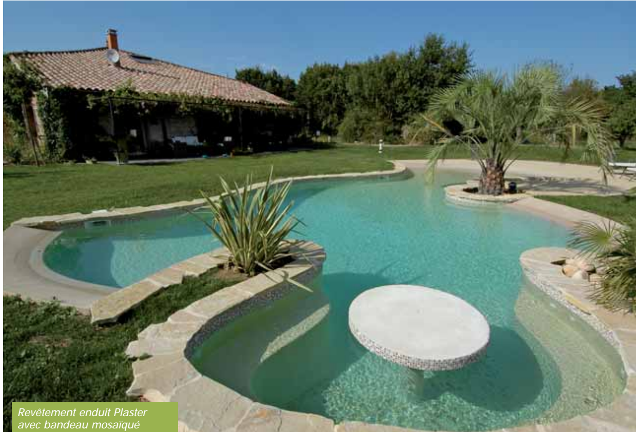
Revêtement enduit Plaster avec bandeau mosaïque (ACP / Diffazur Piscines - 31).

• L'enduit ciment hydrofuge classique sert à lisser, à imperméabiliser et à donner un aspect fini au bassin, en attendant, la plupart du temps, un carrelage ou une peinture. Si l'on conserve trop longtemps un tel enduit comme finition, l'on peut observer que, lentement, le ciment se dissout au contact d'une eau devenue agressive. La silice composant cet enduit devient alors apparente. Du coup, l'enduit accroche le calcaire, les algues et il fixe les germes pathogènes.