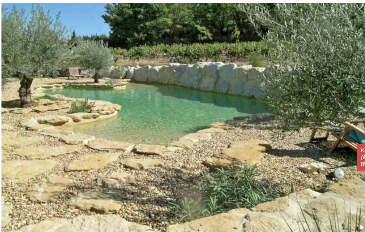
Revêtement Glass Coat (Piscines Jacques Brens - 13 et 84).

Peinture au ciment, peinture à base de caoutchouc chloré ou résines de synthèse (époxy, polyuréthane, acrylique, nouveaux polymères) sont appliquées en plusieurs couches, sur un support propre, sain, lisse et préparé, apte à recevoir ce revêtement.